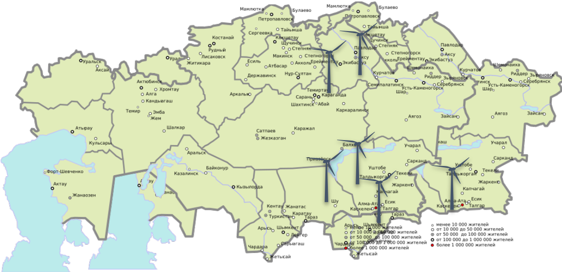
ЖЭК саласындағы офсеттік жобалар

❖ Қысқартудың жалпы саны 4 млн тоннаға жуық CO 2